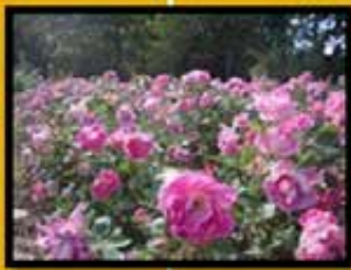
● Parc de la Tête d'Or