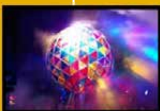
● Fête des lumières