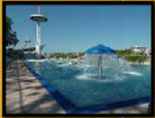
● Piscine du Rhône